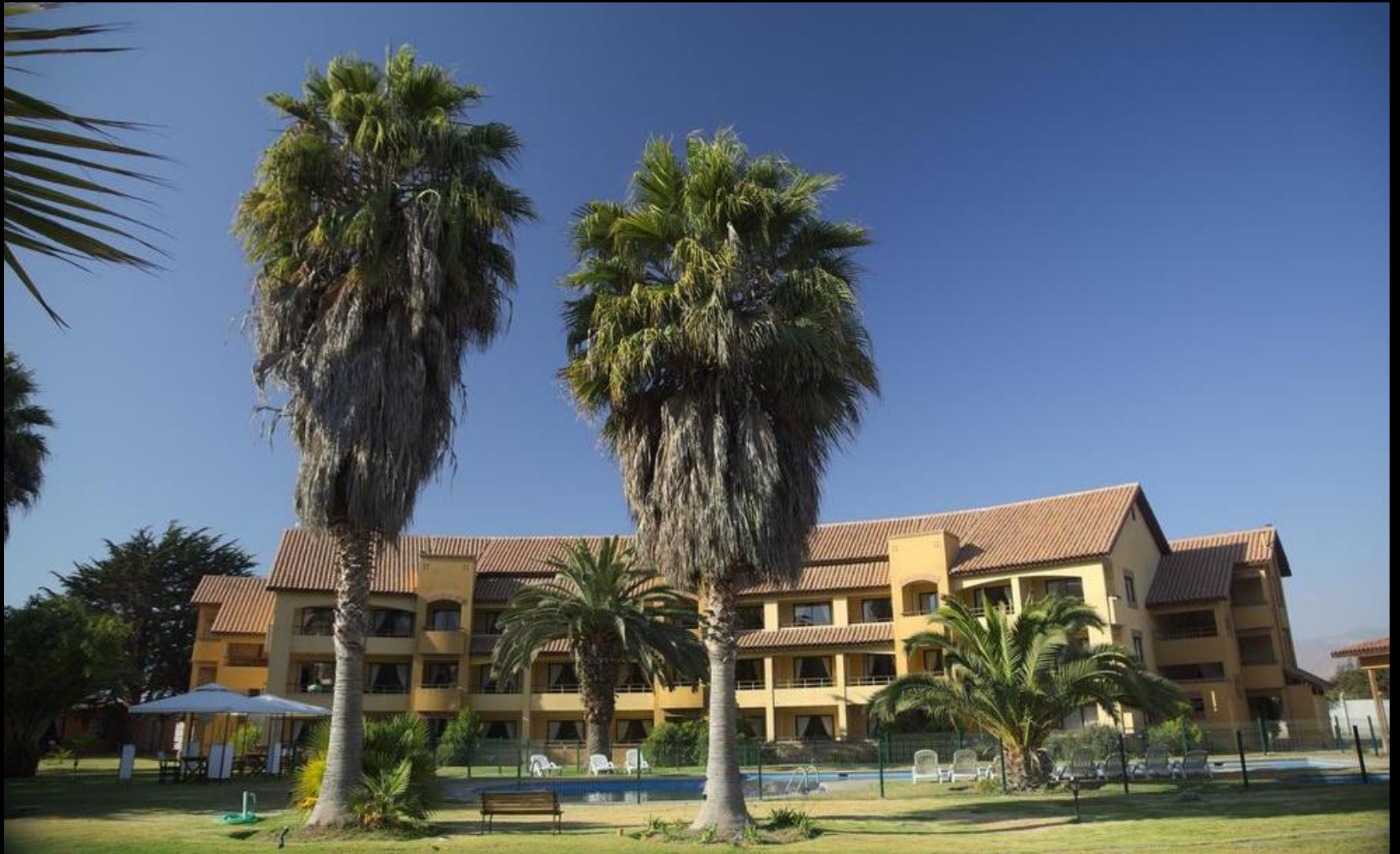
Hotel Playa Campanario